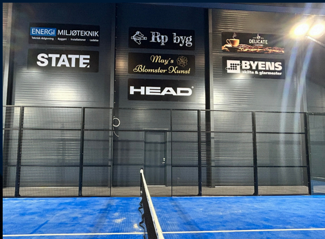
Eksempel på skiltesponsorat - Sølvsponsorat