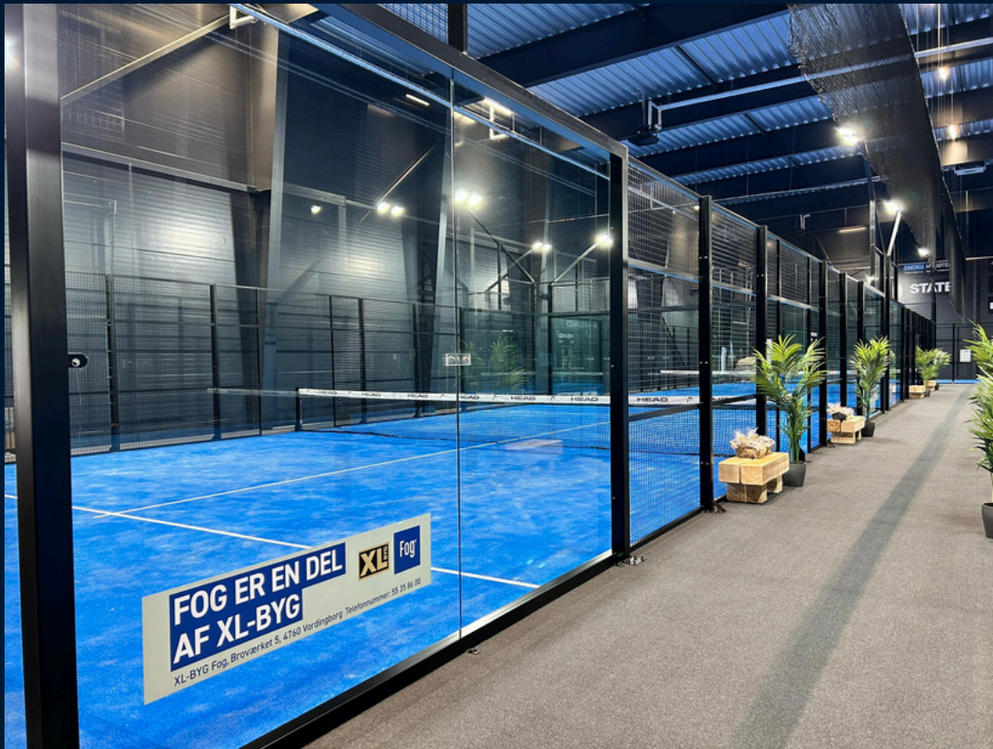
Eksempel på banesponsorat - Diamantsponsorat