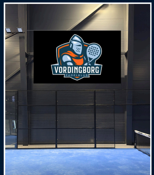
Eksempel på banner